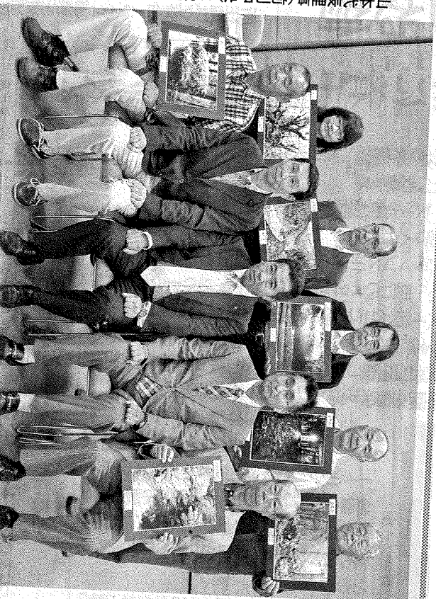
県森林土木建協が写真コンクール表彰式(面に記事)